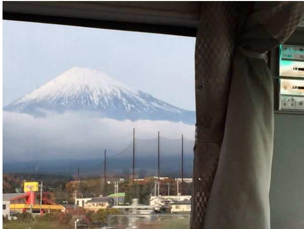
「足柄SA」から眺めた富士山（2015年5月11日撮影）