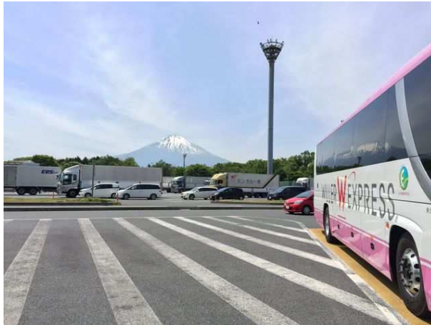
「裾野市駒門」付近から眺めた富士山（2015年1月5日撮影）この付近から見る富士山が最も均整がとれていると思う