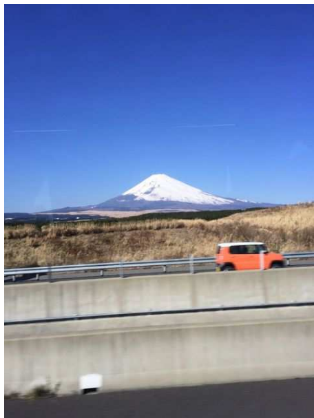
夏の富士山はあまりオモシロくない(足柄付近:2015年7月13日撮影)