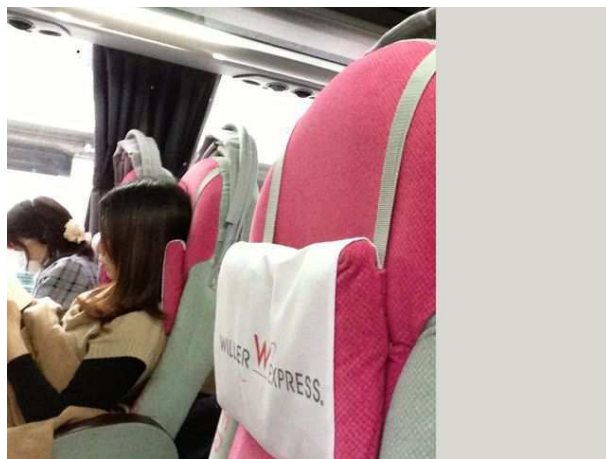
「京都駅八条口」を出て、最初の休憩「草津SA」