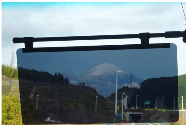
今の時期は、紅葉とのコラボが楽しめる