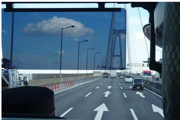
いつもの「吊り橋」を渡る。「地球は丸い」ということが自分の目でわかる