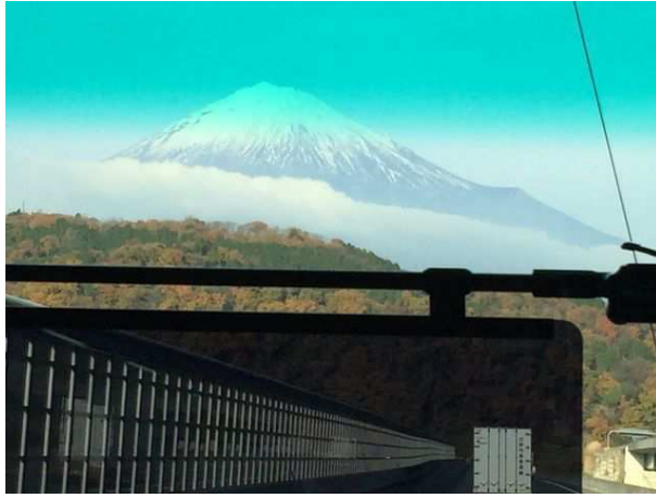
「新富士IC」付近から。神奈川県境に近い「足柄SA」付近まで眺めることができる