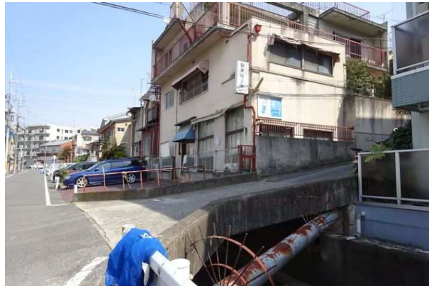
右の坂の上の建物のあたりに御土居は続く。その向こう側に「紫野御土居」石碑がある。