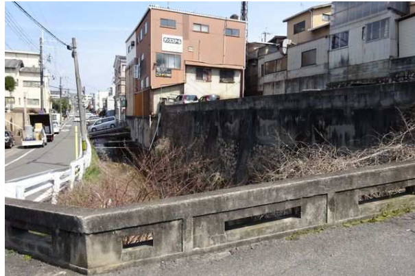
この寺之内橋は、秀吉時代にも掛かっていて、「北野天満宮社家日記」に、秀吉がこの橋付近から御土居を検分したとの記録が残っているようだ。