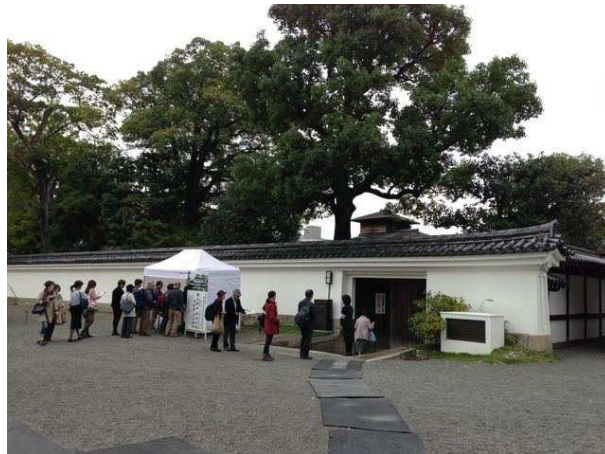
西本願寺書院のほうも拝観者の一人が「今日は二間(ふたま)しか見せてくれないのか。前はもっと奥(公開してる二間は玄関のトナリ)も見せてくれたぞ」と、ワザと?大きな声でシャベっていた。こちらもキビシイ撮影禁止。