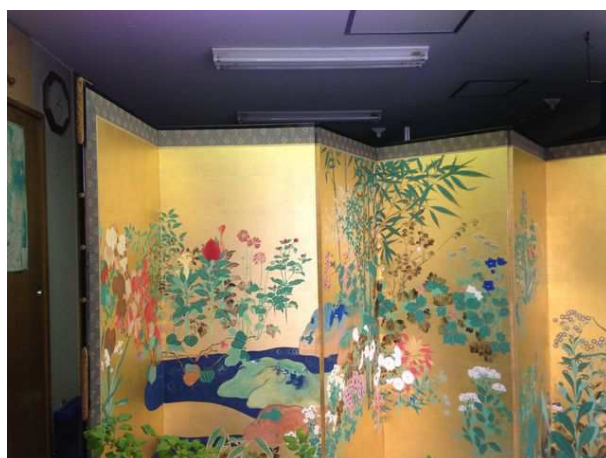
光琳百花园屏風解説