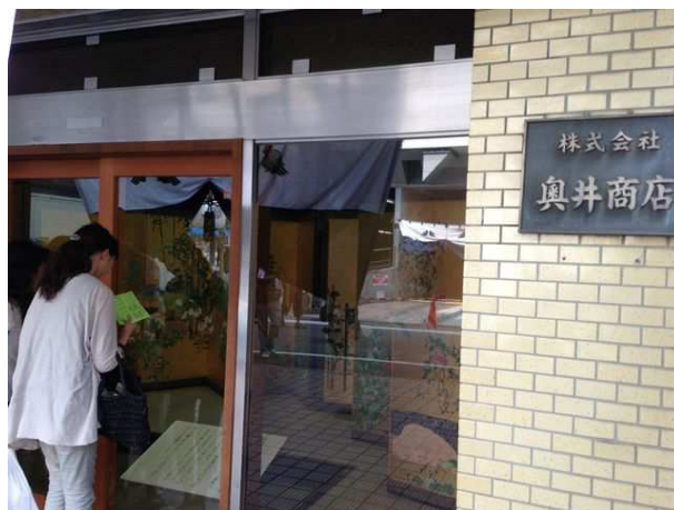
久しぶりの公開！ 光琳百花园屏風