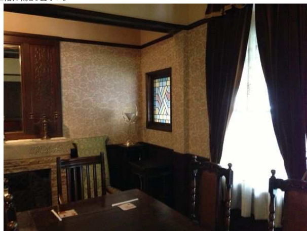
洋間のステンドグラス