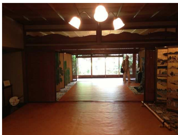
一階廊下(客間・仏間の奥)