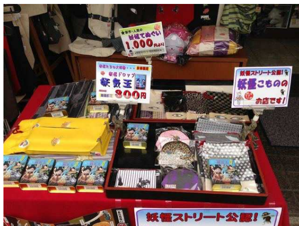
京都限定:妖怪ドロップ「妖気玉」300円 買った