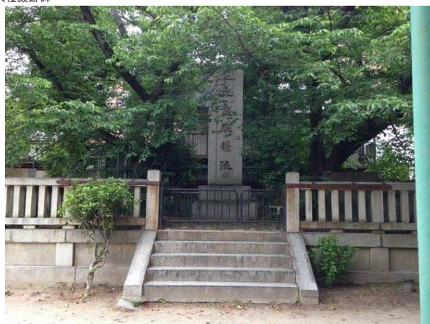
「千本丸太町」バス停より、大極殿跡碑を望む。 左奥の木のしげっている所が大極殿跡碑、右端が千本丸太町交差点