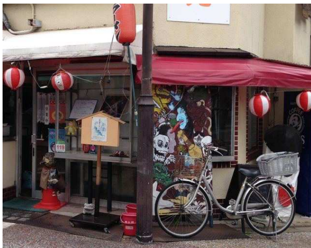
大將軍八神社前にある「妖怪小物店」