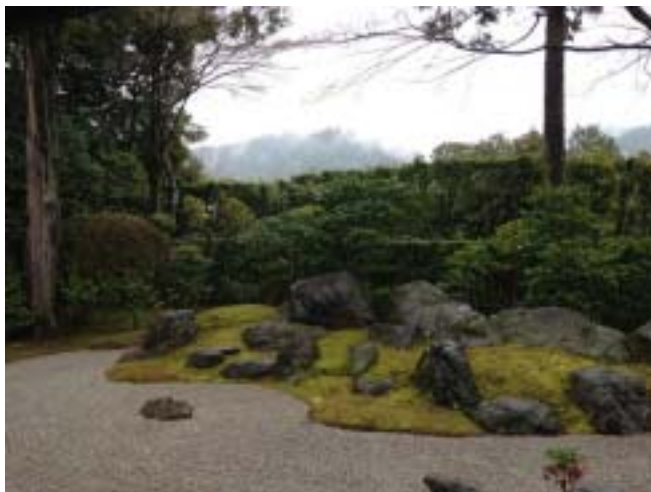
真如堂: 随縁の庭(重森千青/作)