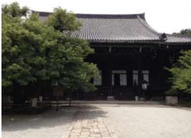
真如堂本堂タテカン