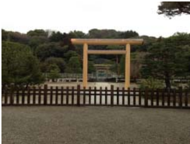
明治天皇陵登り階段