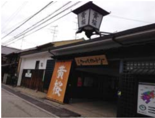
「地ビール煮カレーうどん」「京都地ビール」