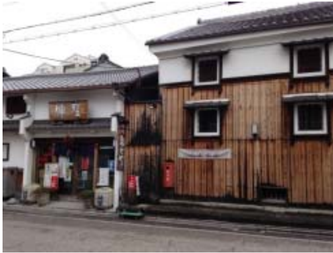
「黄桜」東山酒造直営レストラン