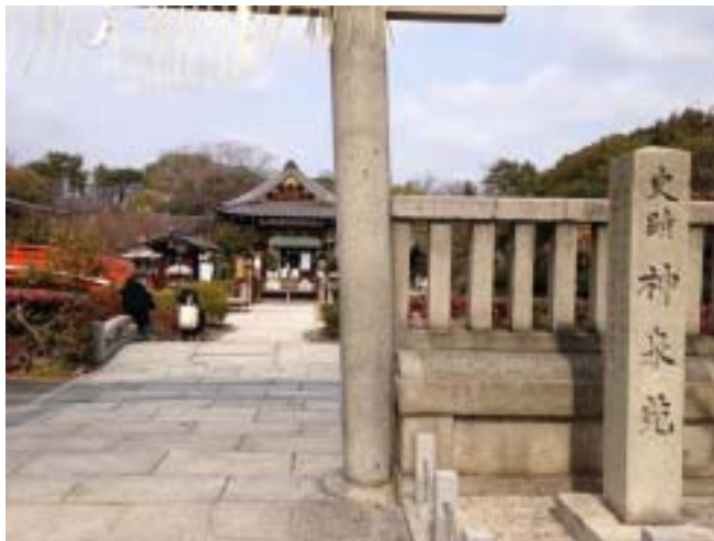
神泉苑:日本唯一の恵方社