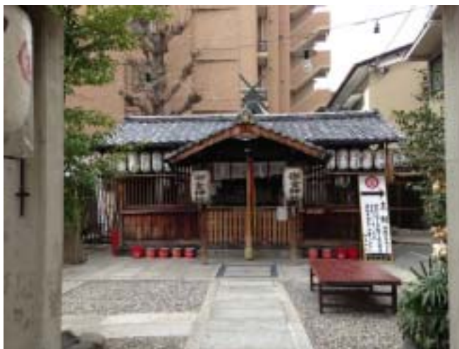
御金神社:奉納絵馬