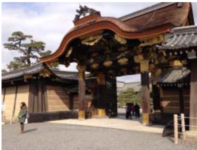
二条城入口:唐門(部分)