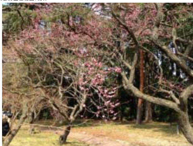
京都府立植物園:梅林二