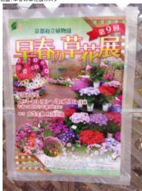
京都府立植物園: 早春の草花展展示